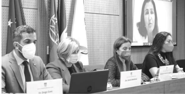
Iniciativa, organizada pelo ISAL, abordou a ética e a saúde.

madeira.pt/regiao/ver/158342/Think_2022_abriu_ontem_com_mais_de_meia_centena_de_investigadores